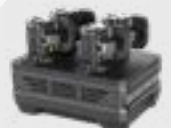
4-х слотова зарядна станція